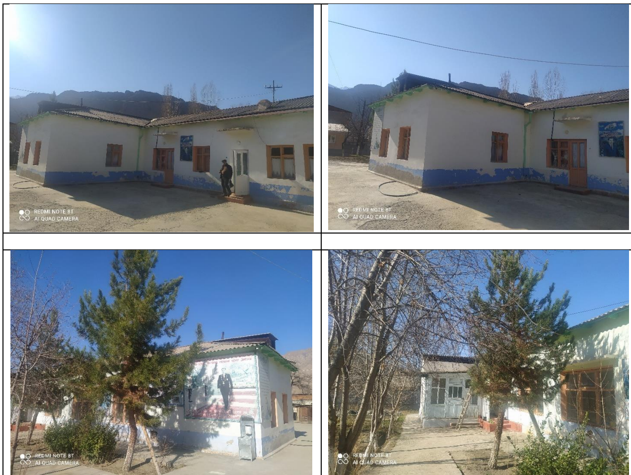
Фото участка выбранного для реализации подпроекта CSP-2B-15

Территория, которое было выбрано для реализации подпроекта CSP-2B-15, находится в махалле Масджиди боло территория детского сада №32. В 6 метрах от территории детского сада №32, находятся жилые дома местных сообществ.