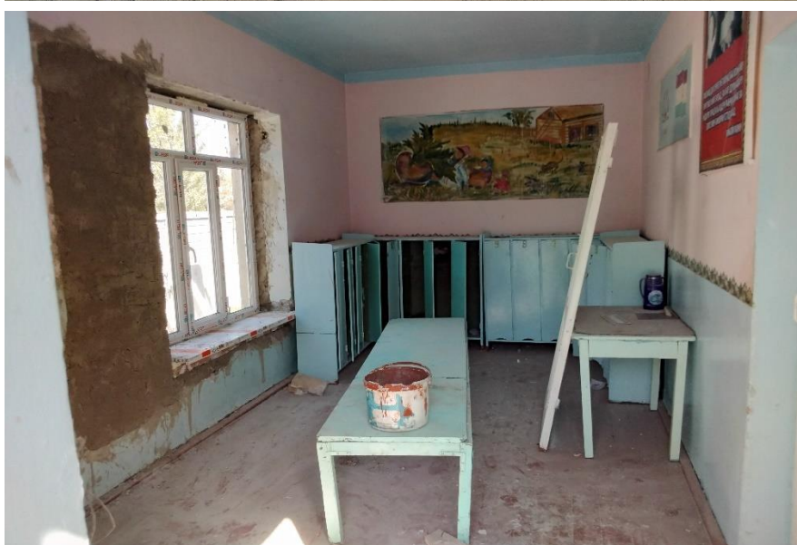
Фото детского сада