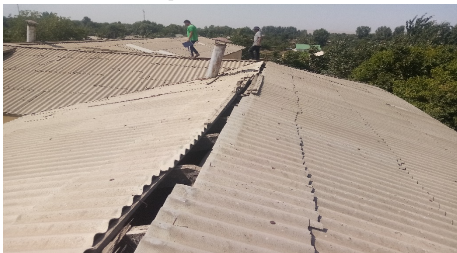
Фото: Состояние кровли учебных корпусов сверху

В рамках реализации подпроекта CSP-2A-65/1 предусмотрено в трёх учебных корпусах заменить всю деревянную конструкцию кровли, его покрытия из асбестных листов на металлическое покрытие (профильные оцинкованные листы), заменить деревянных оконных проёмов на двухслойные пластиковые в общем объёме 1520,5м 2 . Также с заменой всех старых элементов кровли, то есть водосточные трубы, подвешные желоба, коньки, ендовы слуховые окна предусмотрено пожарная сигнализация и камеры видео наблюдения.