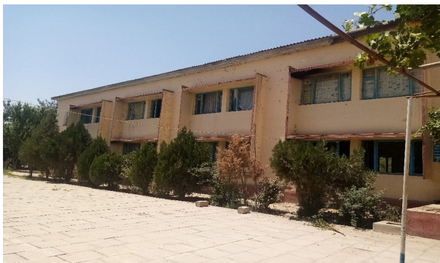
Фото: состояние оконных блоков учебного корпуса средней школы №23 села Замини нав.

деревянная конструкция кровли его покрытия и деревянные оконные блоки пришли к негодности.