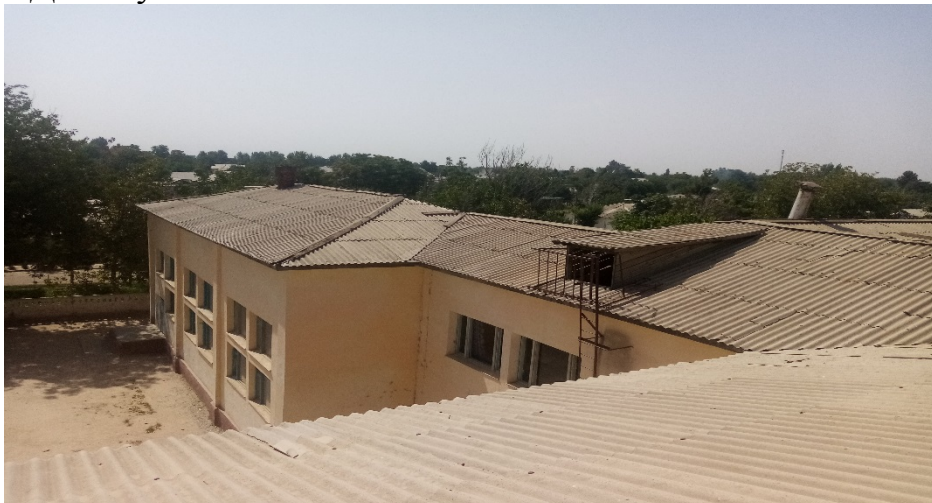
Фото: Состояние кровли учебных корпусов сверху

НСИФТ-а, и согласование архитектора района Джайхун.